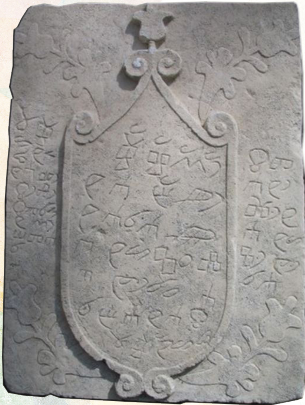
Glagoljička ploča u Arbanasima iz 1766., klesana nedugo nakon doseljenja Arbanasa u okolicu Zadra godine 1726.